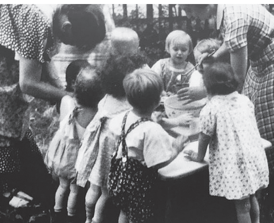
Erzieherinnen und Kinder der Jackson-Kinderkrippe 1937/1938