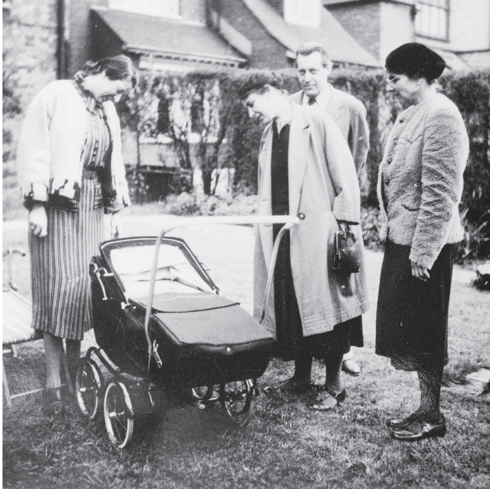
Mutter des Säuglings, Anna Freud, Dorothy Burlingham, Ernst Freud

Nachdem die Bombenangriffe zunahm, galt es abzuwägen, welches die größere Gefahr für die Kinder sein könnte: eine eventuelle körperliche Schädigung durch die Bomben oder eine psychische, wenn sie zum Schutz ihrer körperlichen Integrität aufs Land evakuiert und damit von ihrer Bindungsperson getrennt würden.