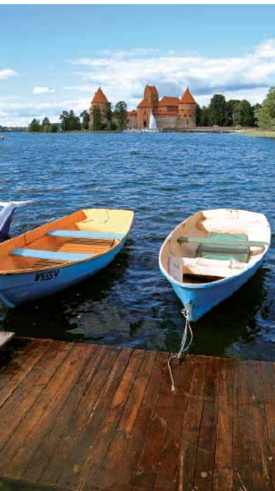
60001 Abb.: 85

Zurück in Vilnius lockt – nicht nur im Sommer – das Künstlerviertel Užupis 24, das man über eine der Brücken über die Vilnia erreicht. Hier hat Vilnius ein anderes Gesicht: ein bisschen frecher und freier. Hier ist man auch schon gleich am richtigen Platz, wenn es darum geht, sich ein nettes Lokal oder einen passenden Ort zu suchen, um am Abend zu feiern. Zum Beispiel im Uzupio klasika (s.S.57), einem gemütlichen Restaurant, oder in der kleinen Bierbar Spunka (s.S.60). Der Abschied aus Vilnius fällt dadurch aber nicht leichter!